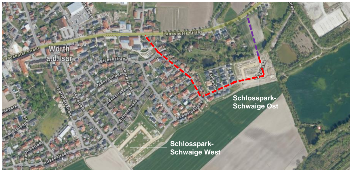
Luftbild aus dem Jahr 2020, bisherige (rot) und neue, zusätzliche Erschließung (lila)

Somit entsteht für das gesamte Wohngebiet „Schlossparkschwaige“ ein Ringschluss über das neue Gebiet „Nordost“ und eine zweite Zufahrt als östlicher Anschluss an die Staatsstraße St 2074. Insbesondere für das neue Baugebiet „Nordost“, den Bauabschnitt „Ost“ sowie den Bauabschnitt II entsteht so eine noch bessere überörtliche Anbindung und zweite Zufahrt im Notfall, z. B. für die Feuerwehr. Die bestehenden Erschließungsstraßen und das Ortszentrum werden entlastet.